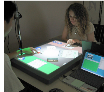
Figure 2: Deux utilisateurs interagissant simultanément avec une table interactive et le logiciel DiamondSpin [6].

Dans cette catégorie de systèmes, plusieurs utilisateurs interagissent avec le même dispositif d'affichage mais en utilisant plusieurs dispositifs d'interaction. Ces systèmes sont décrits par la notation N-1-N/1. Un exemple de Single display groupware est DiamondSpin [6] (figure 2).