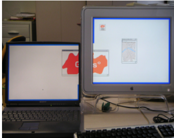
Figure 3: Avec le système I-AM, la fenêtre d'une application s'exécutant sur une machine A peut être affichée en partie sur le dispositif d'affichage de la machine A et en partie sur le dispositif d'affichage d'une machine B, les machines A et B étant reliées via un réseau. Il est bien sûr également possible d'afficher cette fenêtre uniquement sur un des deux dispositifs d'affichage [7].

Deux systèmes, encore au stade de recherche, permettent d'intégrer tous ces comportements. Le premier système est UBIT [1] (grâce à l' Ubit Mouse Server ) qui permet de contrôler plusieurs pointeurs, les différents dispositifs de pointage n'étant pas obligatoirement connectés à la même machine. De plus, l' Ubit Mouse Server permet le contrôle d'une application depuis une machine distante ou encore la migration d'une application d'un affichage à un autre.