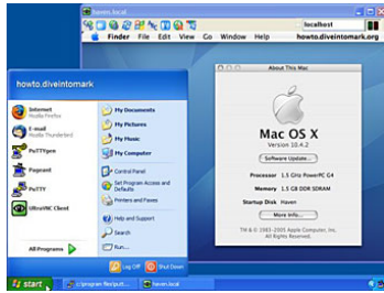
Figure 1: Un bureau MS Windows contenant un bureau MacOS via VNC. MacOS ne s'exécute pas sur la même machine que MS Windows, mais l'affichage du bureau MacOS est reproduit dans une fenêtre de MS Windows.

des serveurs d'objets et des serveurs d'interaction et de rendu. Un serveur d'objets est en fait le noyau fonctionnel d'une application qui expose ses données à un ou plusieurs serveurs d'interaction et de rendu. Les serveurs partagent un modèle conceptuel que le serveur d'interaction et de rendu transforme en un modèle perceptuel. Le serveur d'interaction et de rendu contrôle donc l'interface utilisateur et peut interpréter les interactions de l'utilisateur sur le modèle perceptuel. Ces interactions donnent lieu à des commandes à appliquer au modèle conceptuel qui sont transmises au serveur d'objets.