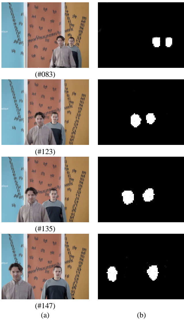
Figure 3 – a) Séquence des images originales, b) Séquence des images binaires.