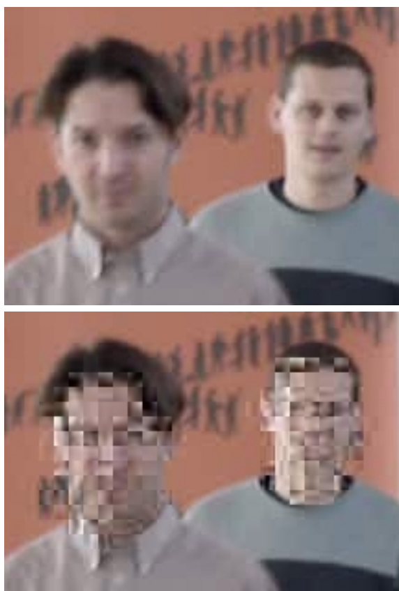
Figure 6 – Région de 216 \times 152 pixels de l'image #123.

Il convient de noter que la sécurité d'un cryptosystème est liée à la capacité de deviner les valeurs des données chiffrées. Par exemple, il est préférable de chiffrer les bits qui sont les plus aléatoires possible. Cependant, la sécurité d'un CS ou d'un CP est toujours plus faible que celle d'un cryptage complet. La raison la plus importante d'accepter ce schéma est la réduction importante du temps de calcul par rapport à un cryptage total. Cependant, en pratique, une attaque est plus difficile sur les coefficients ACs non nuls d'une séquence d'images que sur ses coefficients DC qui sont fortement prévisibles [3, 11].