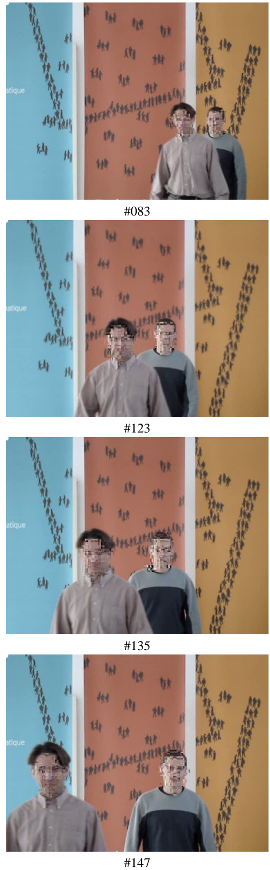
Figure 5 – Séquence d'images cryptée partiellement et sélectivement.