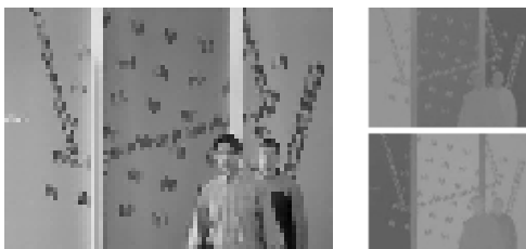
Figure 4 – Imagerie des coefficients DC de l'image #083 pour les plans YUV.