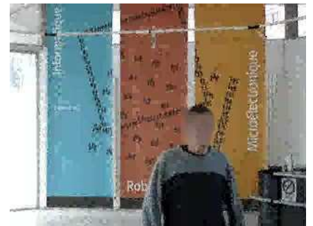
b_3 : frame 105

Vidéo H.264 compressée/décompressée avec notre méthode, sans reconstruction de la RI