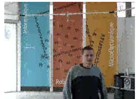
c_3 : frame 105

Vidéo H.264 compressée/décompressée avec notre méthode, avec reconstruction de la RI