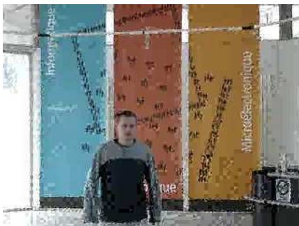
c_1 : frame 75

Vidéo H.264 compressée/décompressée avec notre méthode, sans reconstruction de la RI