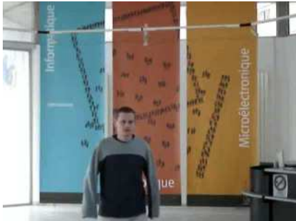
a_1 : frame 75