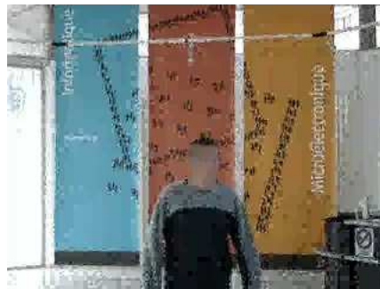
b_2 : frame 90