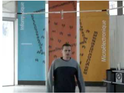
a_2 : frame 90