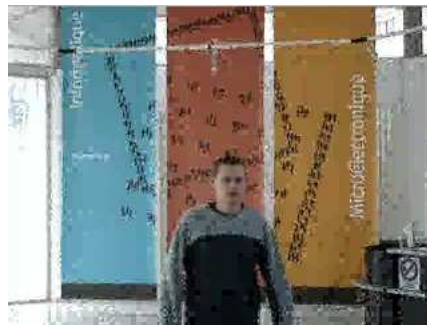
c_2 : frame 90