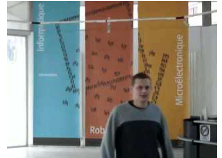
a_3 : frame 105