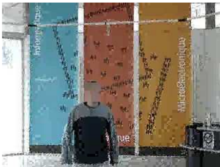
b_1 : frame 75