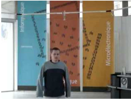
a_1 : frame 75