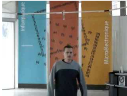
a_2 : frame 90