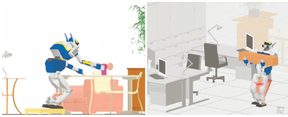
Fig. 2. Exemples de simulations dans lesquelles le robot porte des objets.