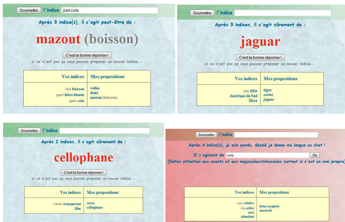
Figure 1 : Quelques exemples de parties. Dans les trois premiers cas, AKI a trouvé le terme cible. Dans le quatrième cas, ne pouvant plus faire de proposition, AKI a abandonné et l'utilisateur a saisi la bonne réponse (il s'agissait donc d'une utilisation ludique de AKI).

Les utilisateurs d'AKI ont la possibilité de faire précéder leur indice de mot-clé faisant référence à des fonctions lexico-sémantiques. Actuellement il est possible d'utiliser dix fonctions : hyperonymie, hyponymie, synonymie, antonymie, domaine, matière, lieu (lieu typique où l'on peut trouver ce que l'on cherche), caractéristique, holonymie, méronymie. Elles correspondent toutes à un type de relation existant dans le réseau JeuxDeMots.