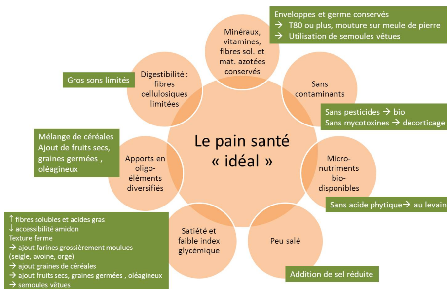
Figure 3. Moyens d'atteindre les buts nutritionnels

L'illustration sur la filière boulangère est schématisée par la figure 3 pour les aspects nutritionnels.