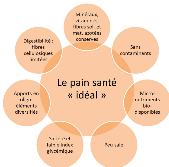
Figure 1. Buts nutritionnels