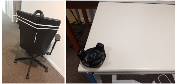
FIGURE 4 – VIVE Controller fixé à la chaise (à gauche) et VIVE Tracker fixé à la table (à droite)