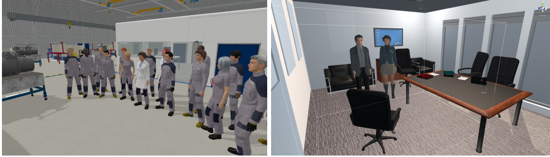
FIGURE 3 – Scènes de simulation