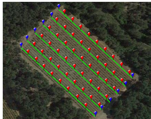
FIGURE 1 – Parcelle avec les sites d'échantillonnage candidats (rouge) et les extrémités de rangs (bleue).

Les points d'échantillonnage sont choisis parmi un ensemble de sites candidats. Il s'agit d'un sous-ensemble de pieds de vigne qui peuvent être répartis sur une grille régulière ou obtenus par d'autres méthodes. Par exemple, la figure 1 montre une parcelle expérimentale où 53 sites candidats ont été échantillonnés afin de pouvoir tester différentes méthodes d'échantillonnage sur un sous-ensemble de ces points.