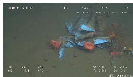
FIG. 1: Image de la base de données TrashCan.

TrashCan est une base de données sémantiquement segmentée regroupant 7 212 images extraites consécutivement à partir de 312 séquences vidéos prises par JAMSTEC, depuis 1982, dans la mer du Japon.